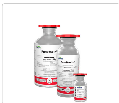
Fosfeto de Alumínio